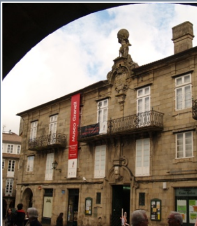
Biblioteca da Fundación Eugenio Granell

Pazo de Bendaña. Praza do Toural s/n 15705 Santiago de Compostela tel. 981 572 124 / 981 576 394 fax.981564069