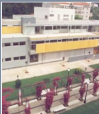
Biblioteca P. M. Valle-Inclán de Redondela

Edificio Multiusos-Paseo da Xunqueira, s/n-1º andar 36800-Redondela 986 401 561 bibliotecaredondela@redondela.es