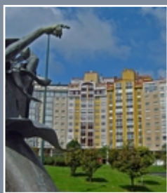
Biblioteca dos Rosales

Praza Elíptica 1 15008 A Coruña Tel.: 981 900 719 brosales@coruna.es